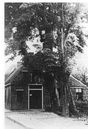
Smederij Pastoor op de kop van de Kerkstraat vanaf de Schoolstraat.